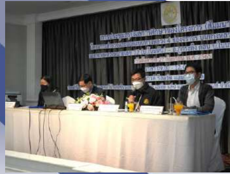
ผู้แทนกรมทางหลวงและบริษัทที่ปรึกษา ตอบข้อซักถาม