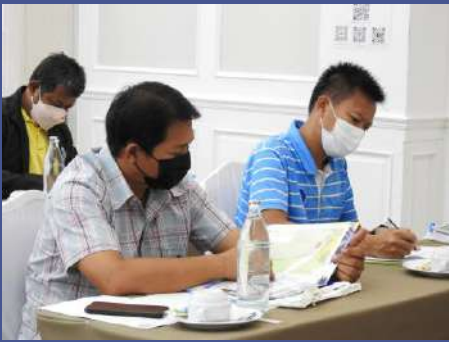
ผู้เข้าร่วมประชุมรับฟังรายละเอียดโครงการ