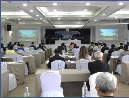
ผู้เข้าร่วมประชุมรับชมวิดีโอโครงการ