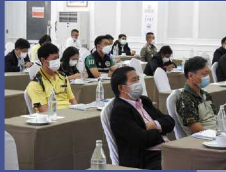
ผู้เข้าร่วมประชุมรับฟังรายละเอียดโครงการ