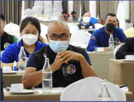
ผู้เข้าร่วมประชุมแสดงความคิดเห็น