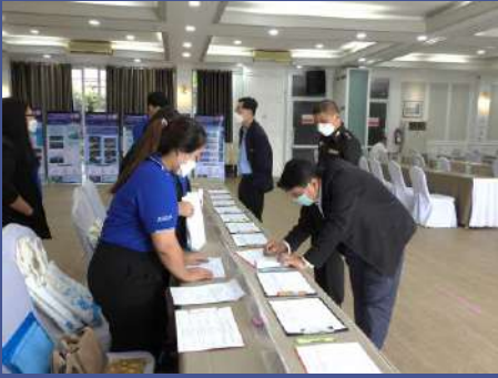
ผู้เข้าร่วมประชุม ลงทะเบียนรับเอกสารการประชุม