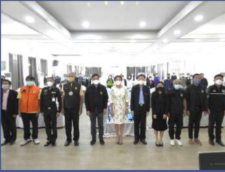
ผู้เข้าร่วมประชุมถ่ายภาพร่วมกัน