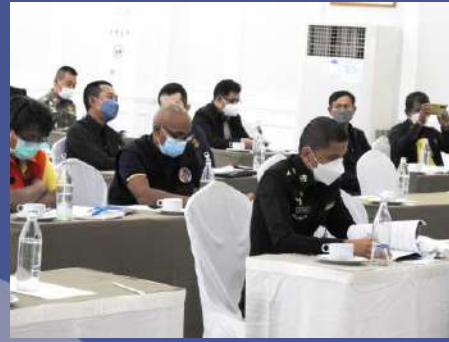
ผู้เข้าร่วมประชุมรับฟังรายละเอียดโครงการ